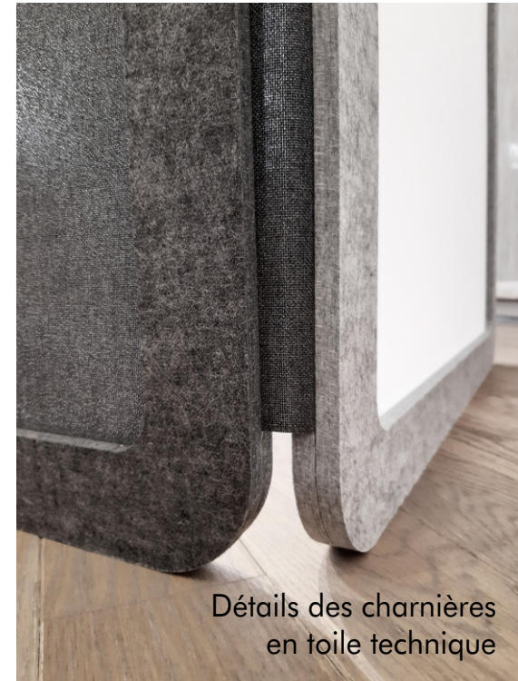
Détails des charnières en toile technique